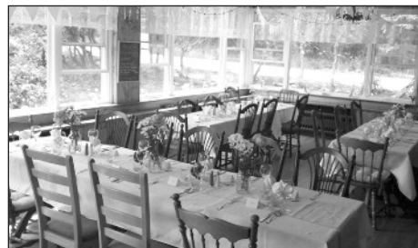
Salle à manger de l'Auberge Hammak.

Le Tourniquet est un concept brésilien qu'on a amélioré à notre façon en offrant des viandes exotiques du Terroir. Le chef est en salle et vous sert à l'épée les viandes qui sont cuites sur charbon de bois dans un foyer ancestral.